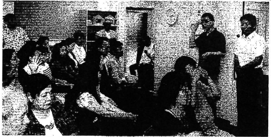
「すまいる」の交流会であいさつする、いさ氏(右端)